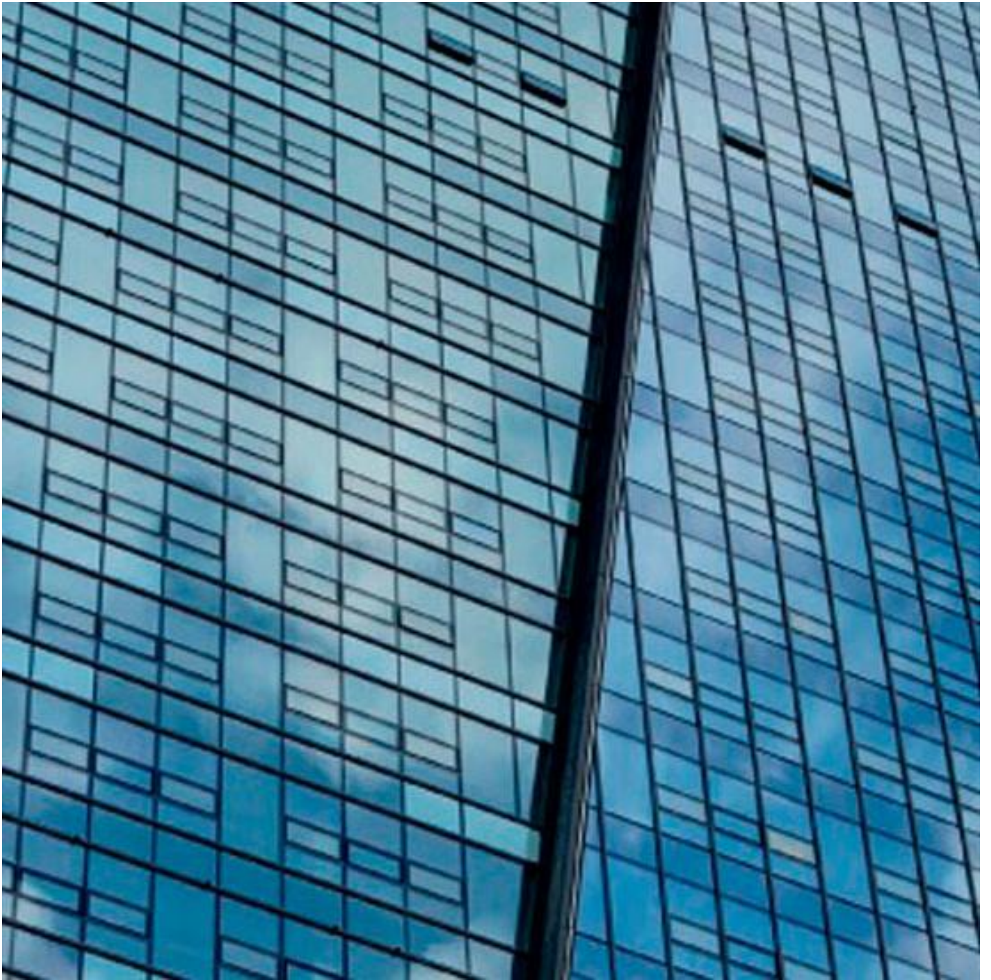
Glas voor façade