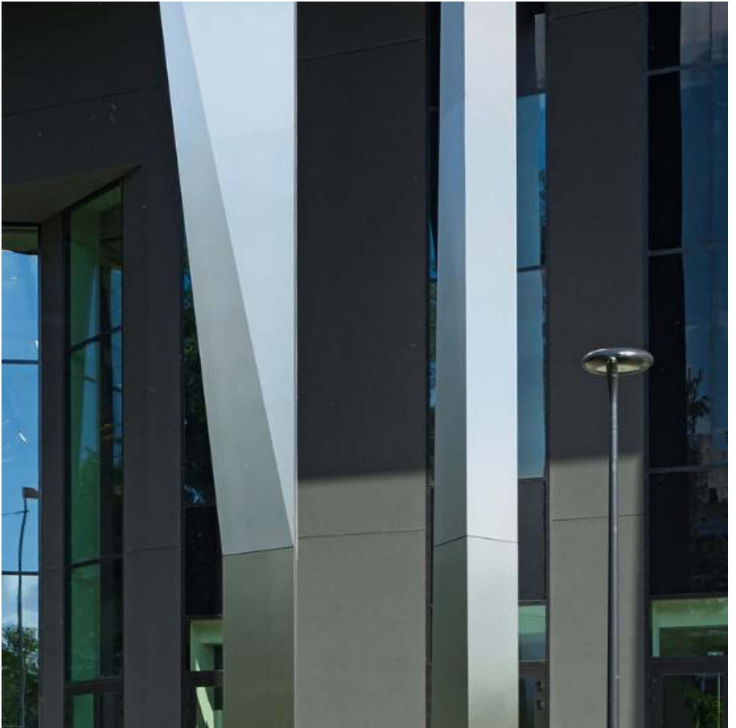
COOL-LITE XTREME 60/28