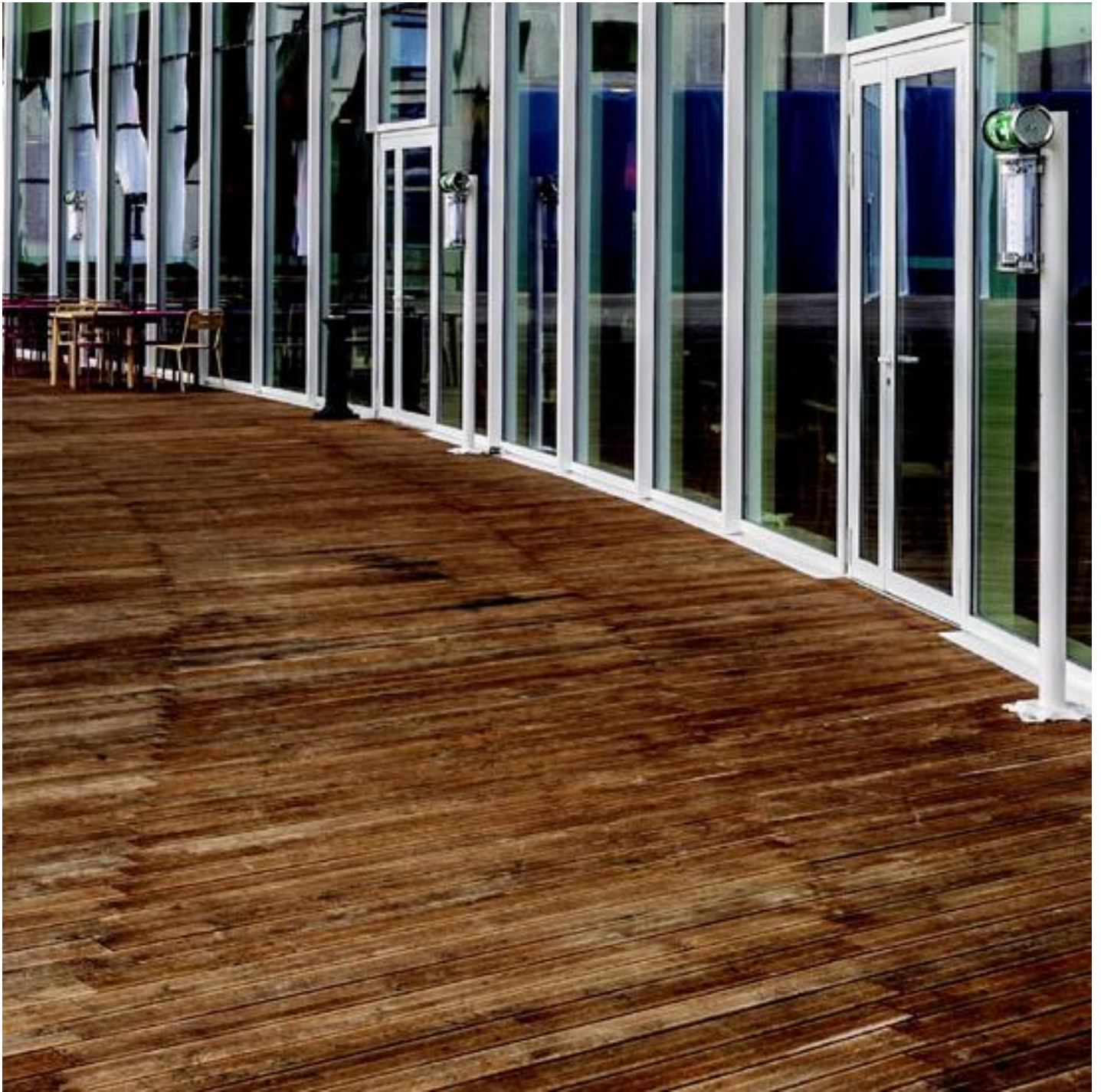
COOL-LITE SKN 145