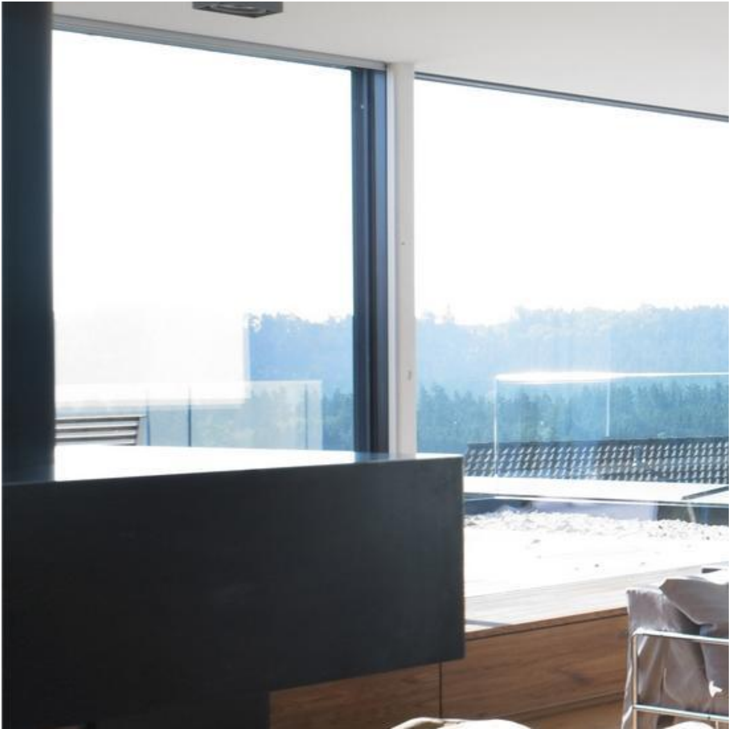
CLIMAPLUS ONE ECOTEC