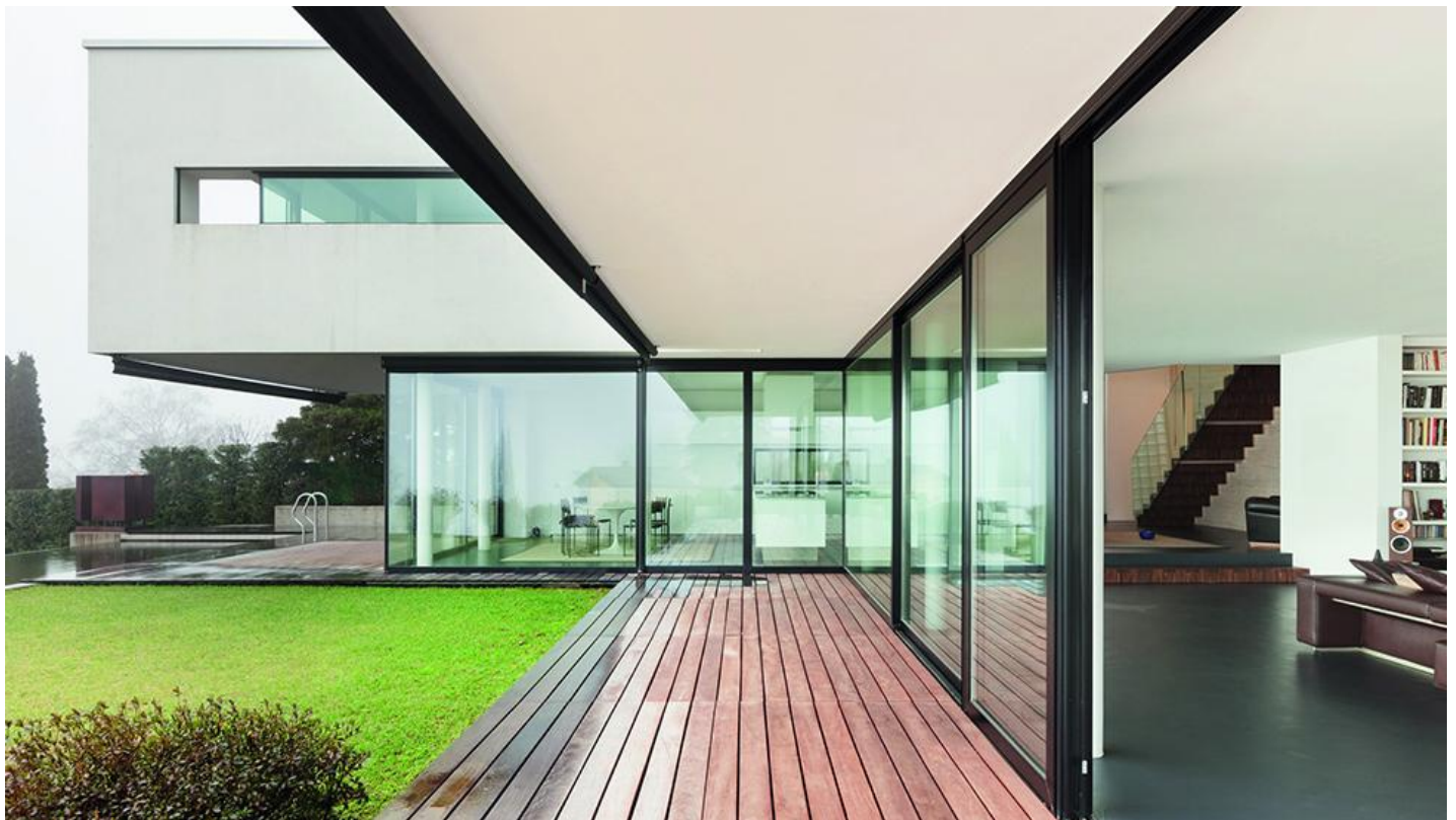
Maximaal genieten van zonlicht en gratis zonnewarmte