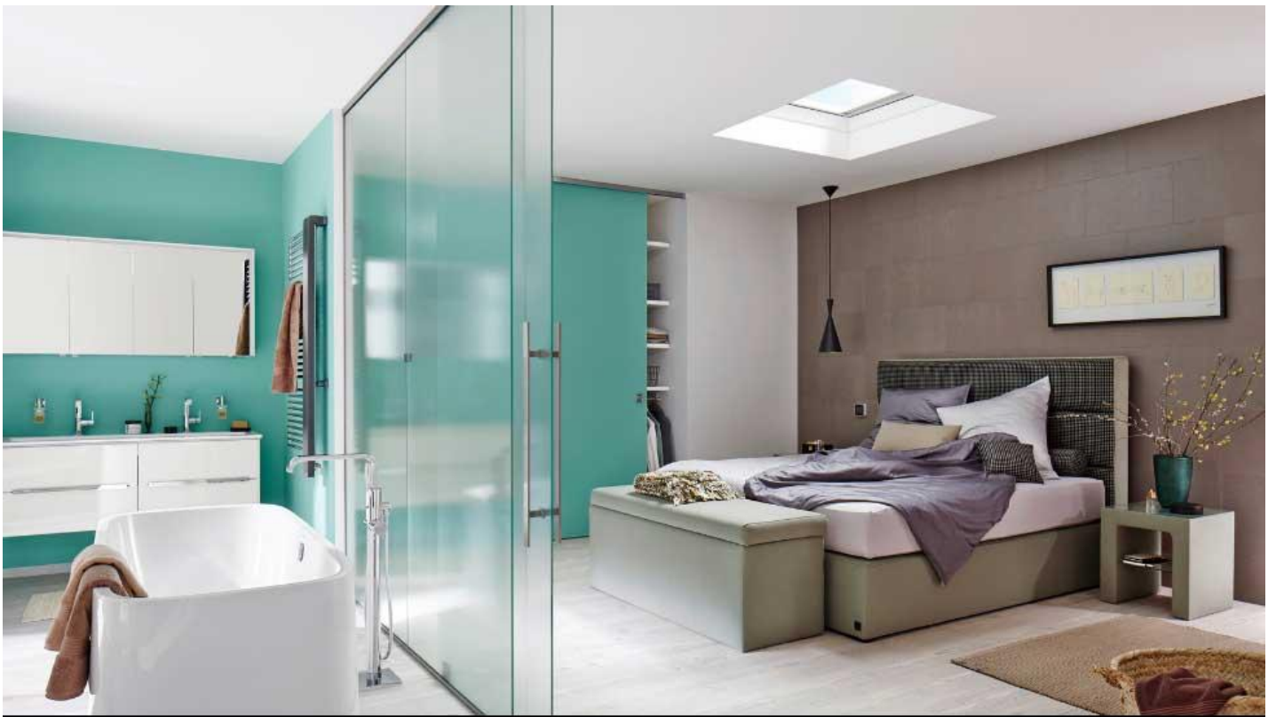
Glas als scheidingswand of schuifdeur voor meer licht in je woning