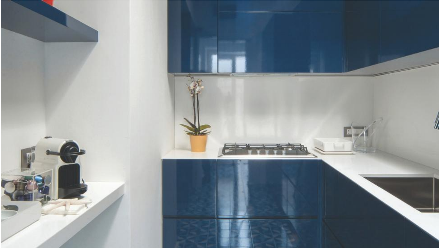
Het beste en mooiste interieurglas voor elke toepassing