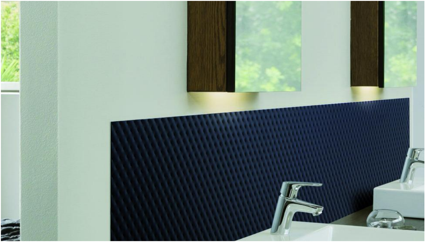
Mastersoft Color IT : Gelakt glas voor een prachtig interieur