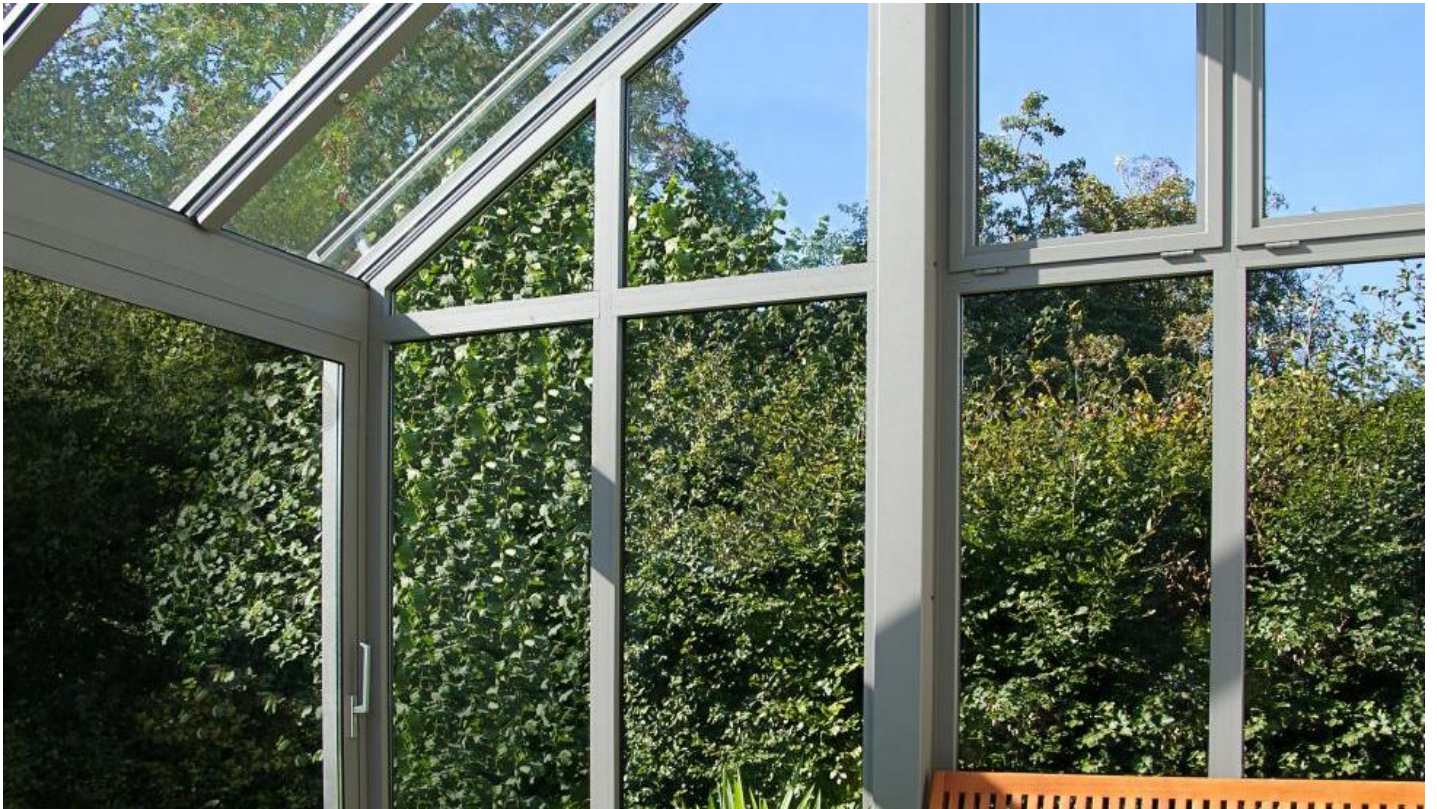
Beglazing voor veranda's & serres