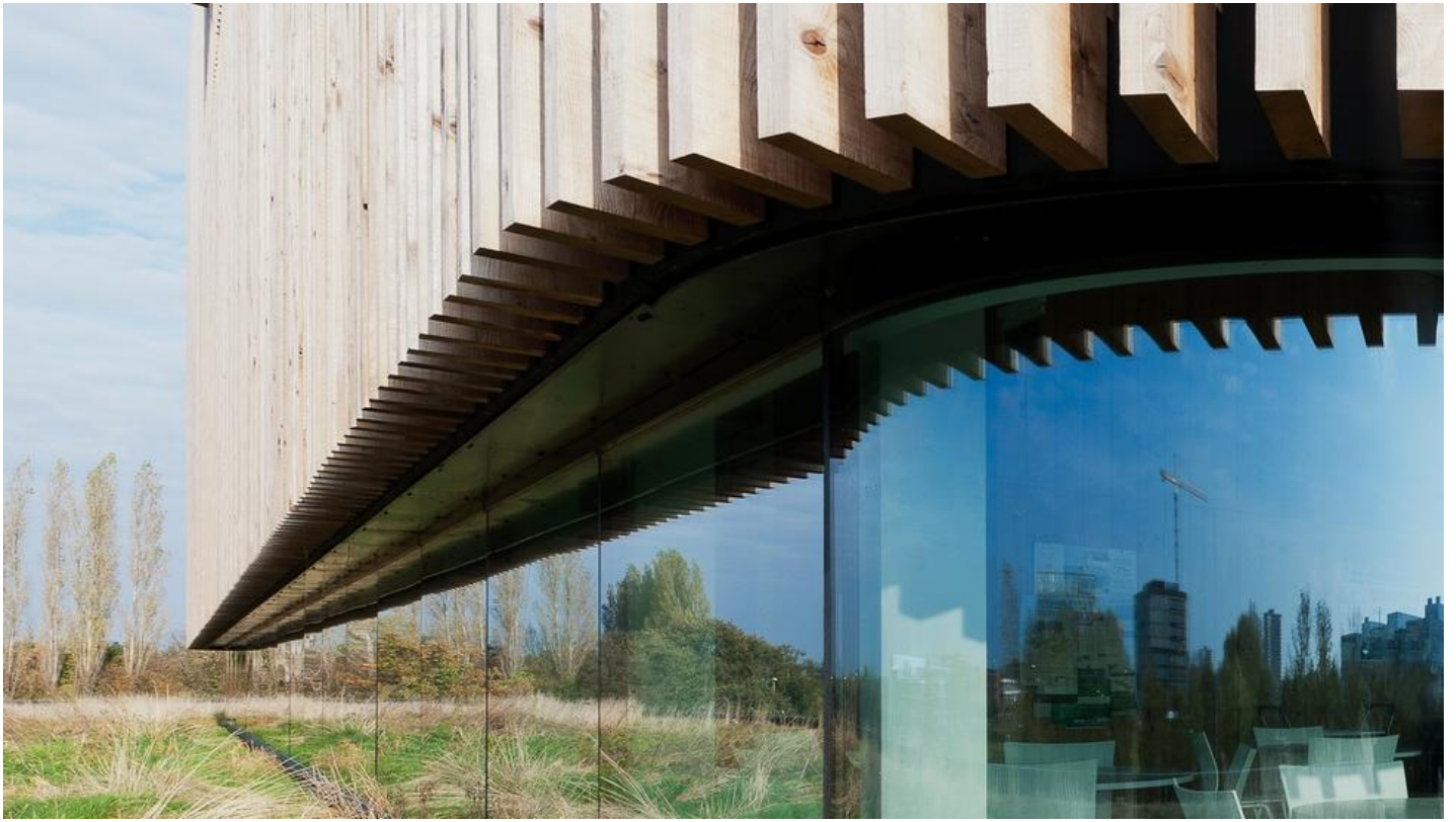
Zonwerende beglazing Cool-Lite SKN 145 | Saint-Gobain Building Glass