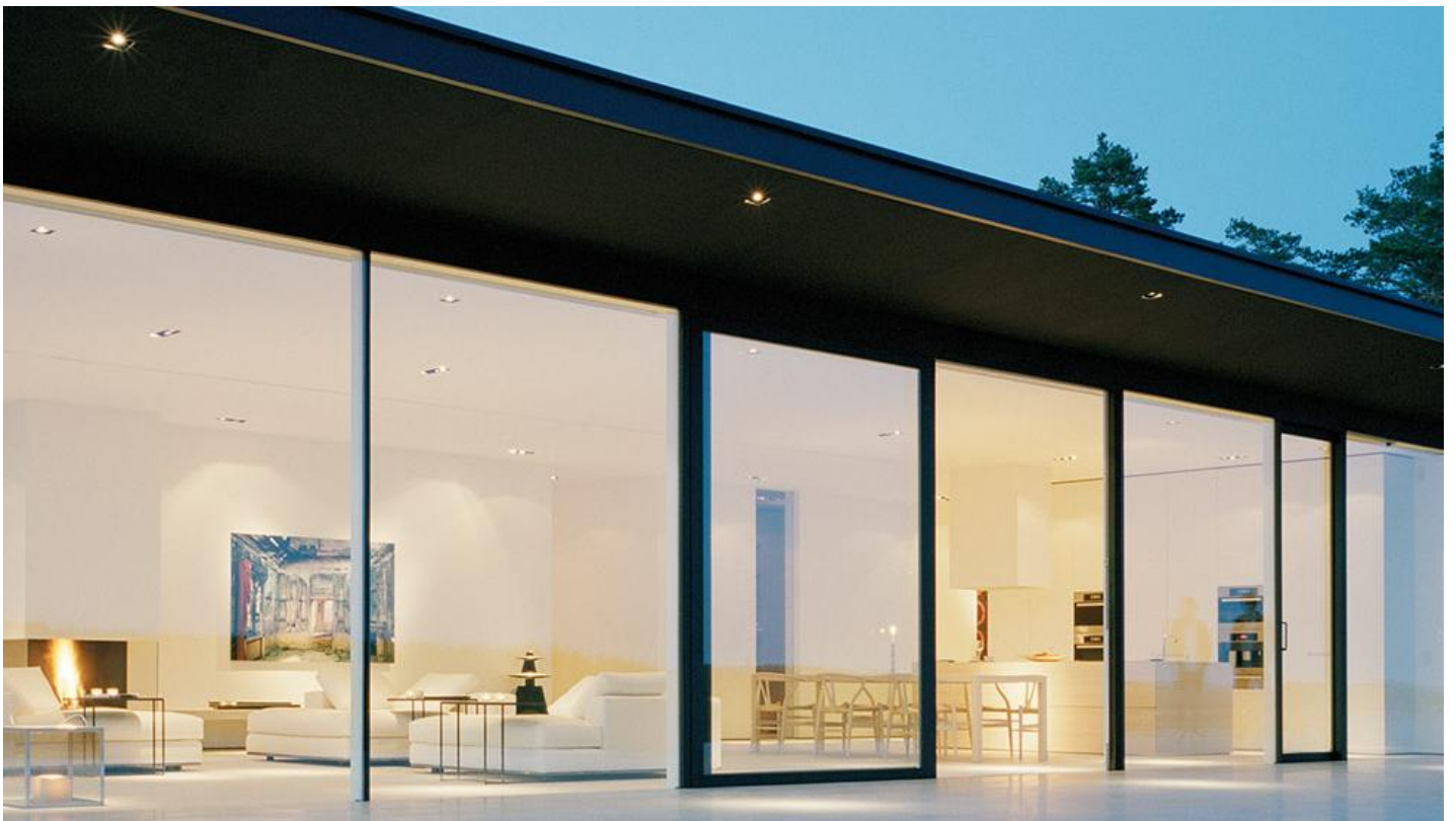
Eglas | Saint-Gobain Building Glass Verwarmend glas