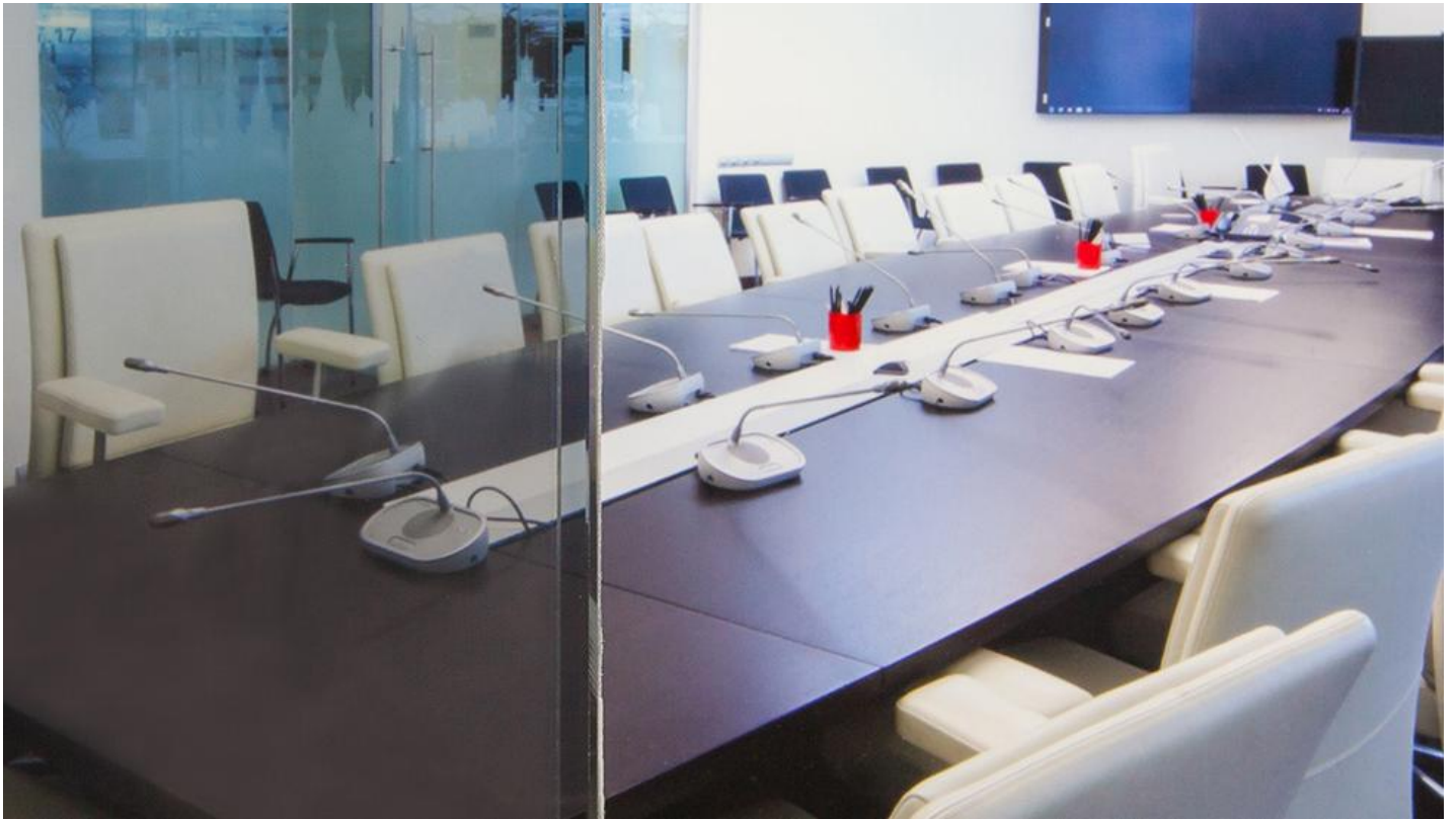
PRIVA-LITE maakt je werkomgeving, kantoor of bureau efficiënter