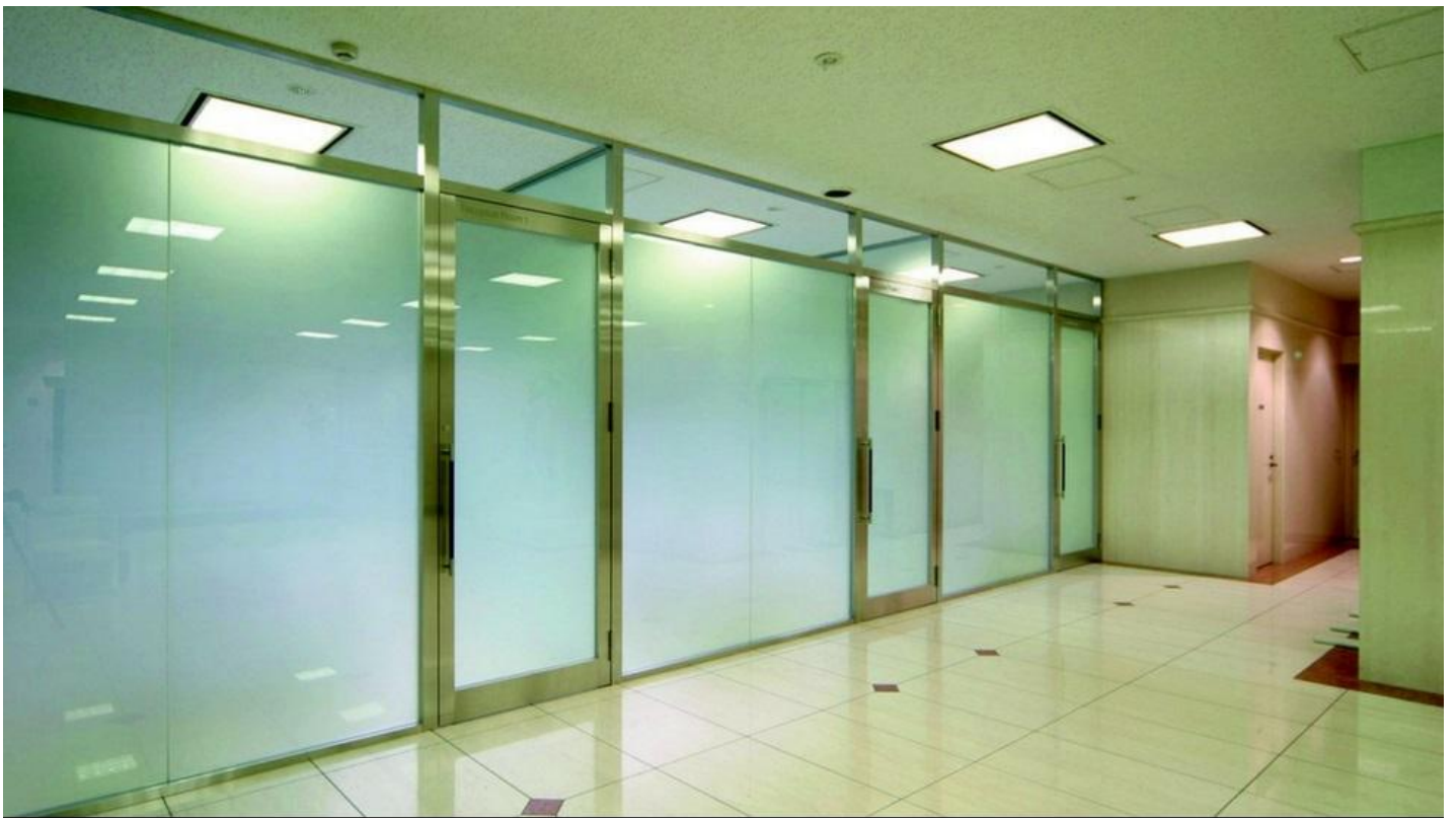
De PRIVA-LITE is ideaal om je vergaderruimte af te sluiten of net niet