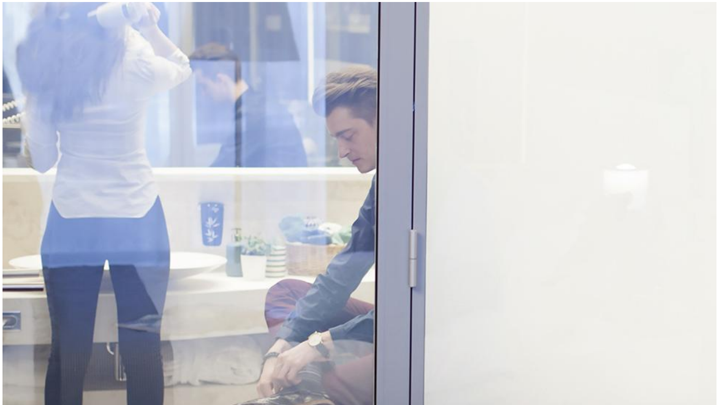
Controleer je privacy met PRIVA-LITE