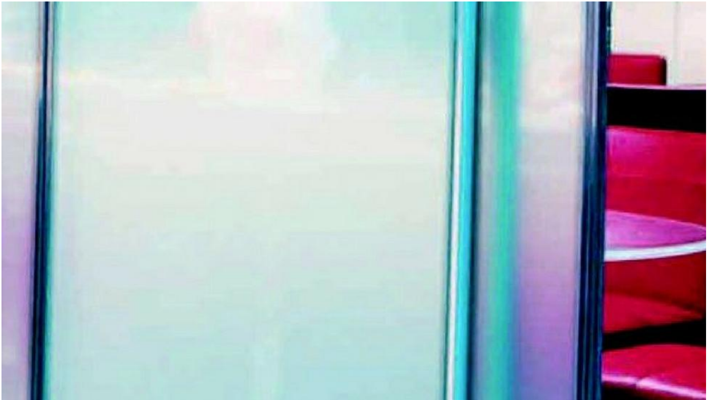
PRIVA-LITE : Maak de wand transparant of ondoorzichtbaar met het glas van Saint-Gobain Building Glass