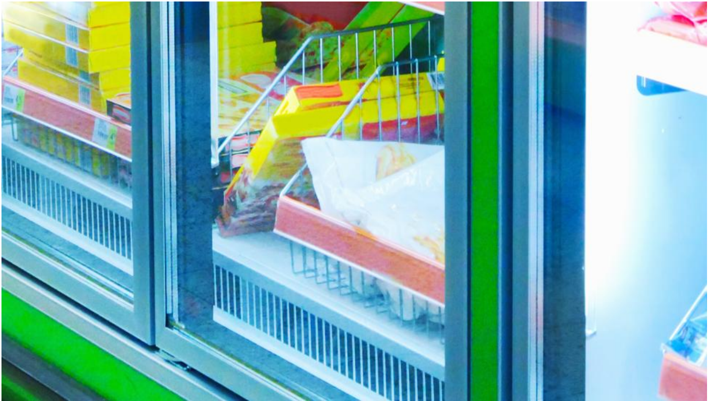
Beglazing van Saint-Gobain Building Glass met minimale reflectie : VISION-LITE