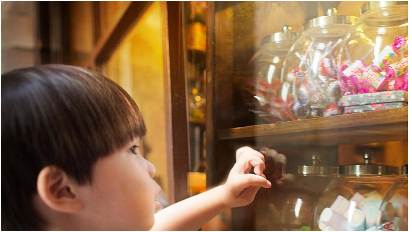
De beste vitrines zijn die met ontspiegelend glas