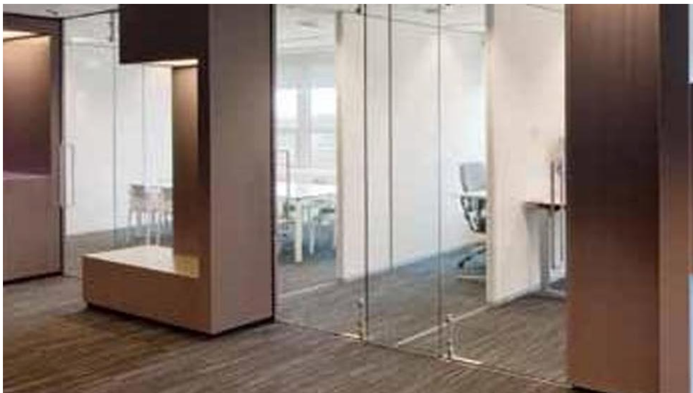
SYSTEMS CLIP-IN | Geluiddempende esthetische glazen scheidingswanden | Saint-Gobain Building Glass