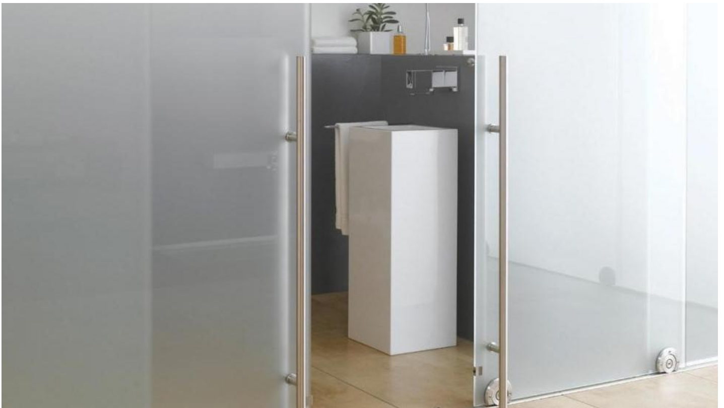
Gematteerd glas voor diffuus licht en privacy | SATINOVO MATE van Saint-Gobain Building Glass