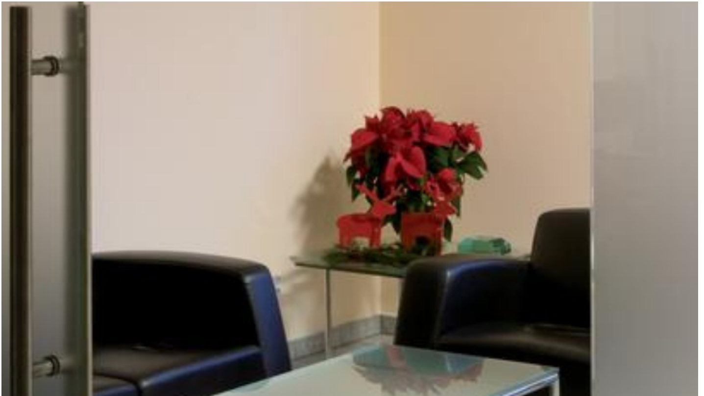
SGG SATINOVO MATÉ | Geëts of gezuurd glas voor een prachtig interieur