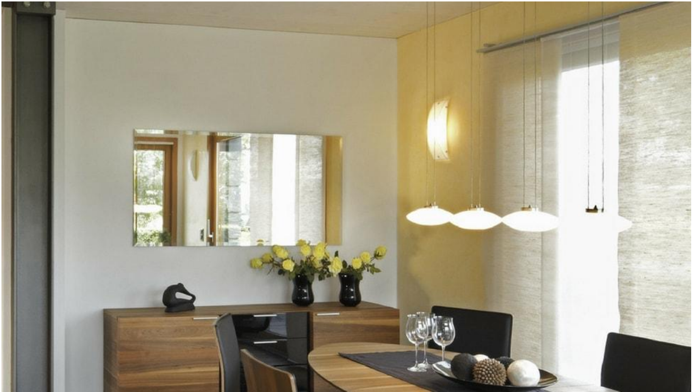
Geniet van nog meer thermisch comfort met CLIMATOP