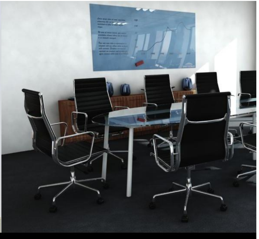
PLANILAQUE MEMORY | Magnetisch gelakt glas als markerboard in uw vergaderzaal of thuis