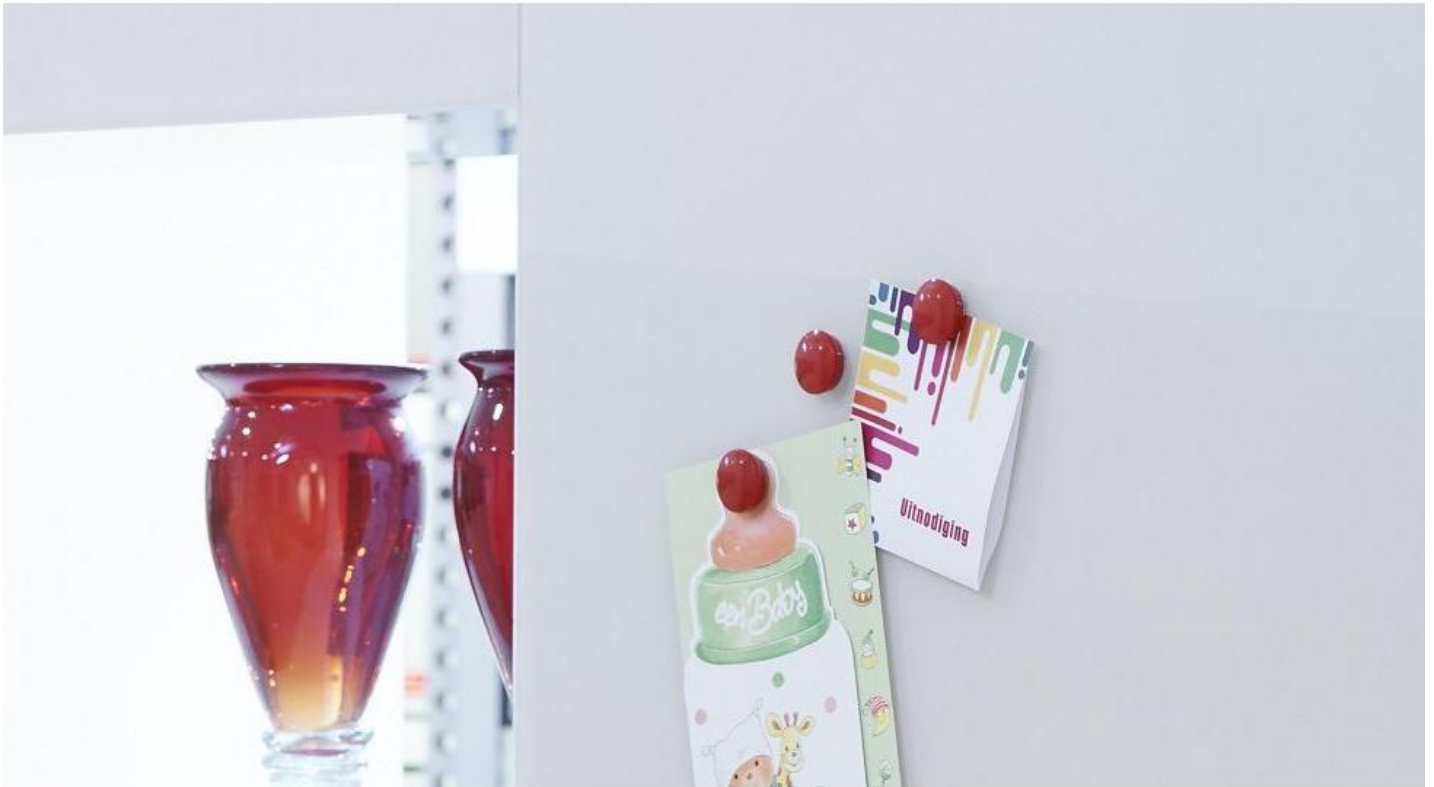
PLANILAQUE MEMORY | Saint-Gobain Building Glass