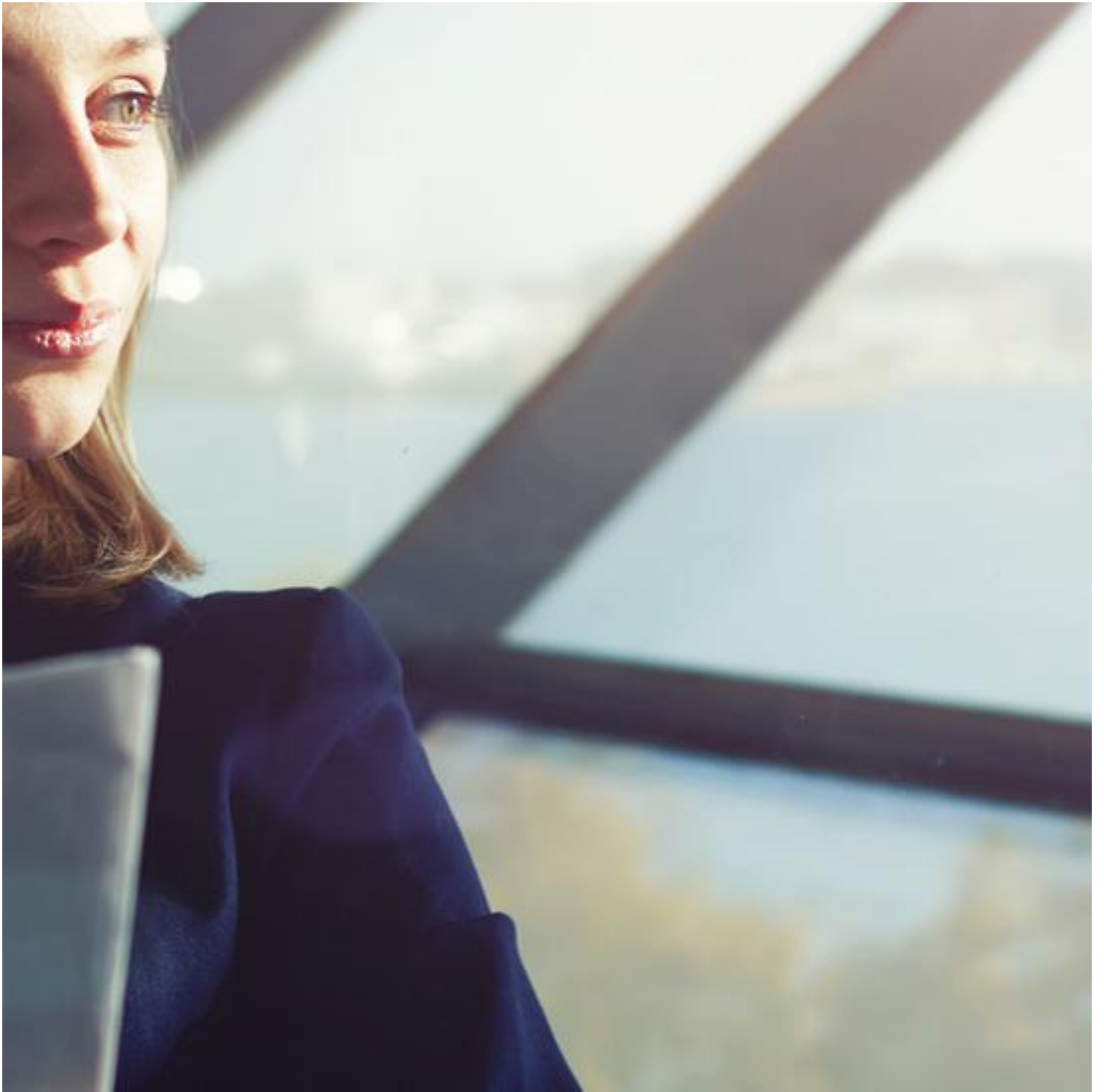
COOL-LITE XTREME 61/29