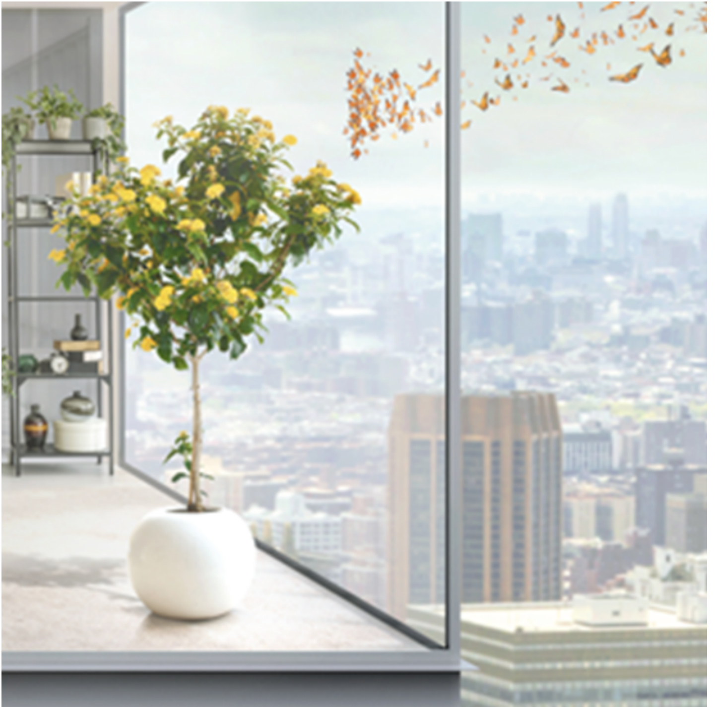
COOL-LITE XTREME 70/33