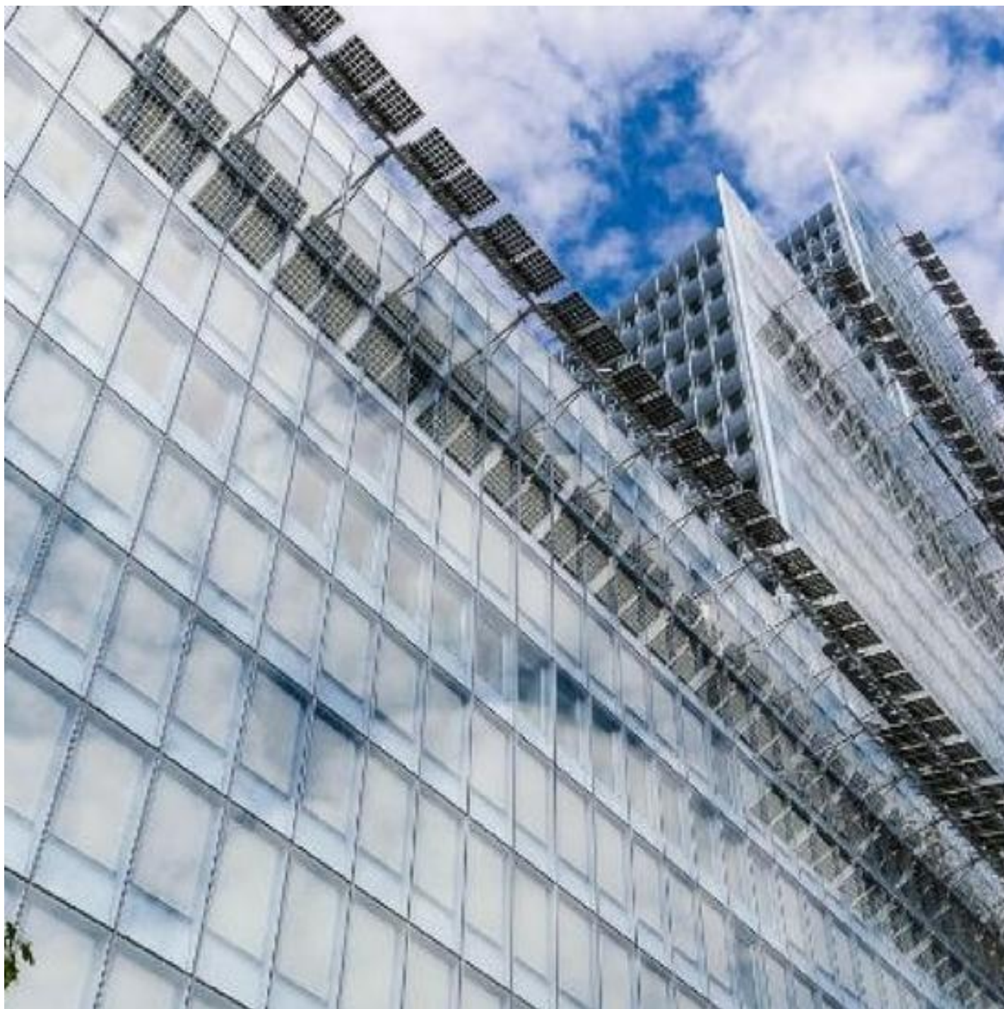
COOL-LITE ST BRIGHT SILVER

Ontdek de andere zonwerende glasproducten van Saint-Gobain Building Glass