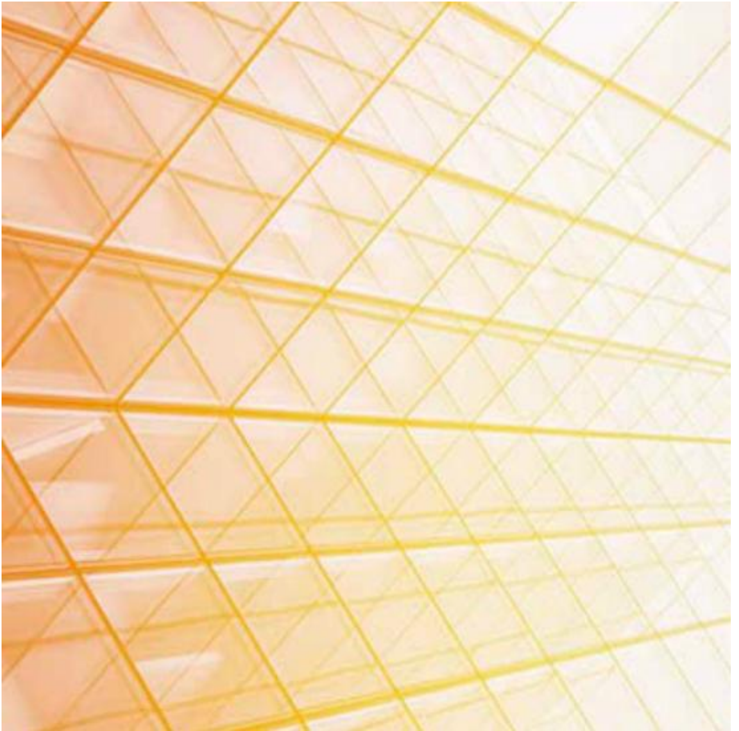
COOL-LITE KG 137