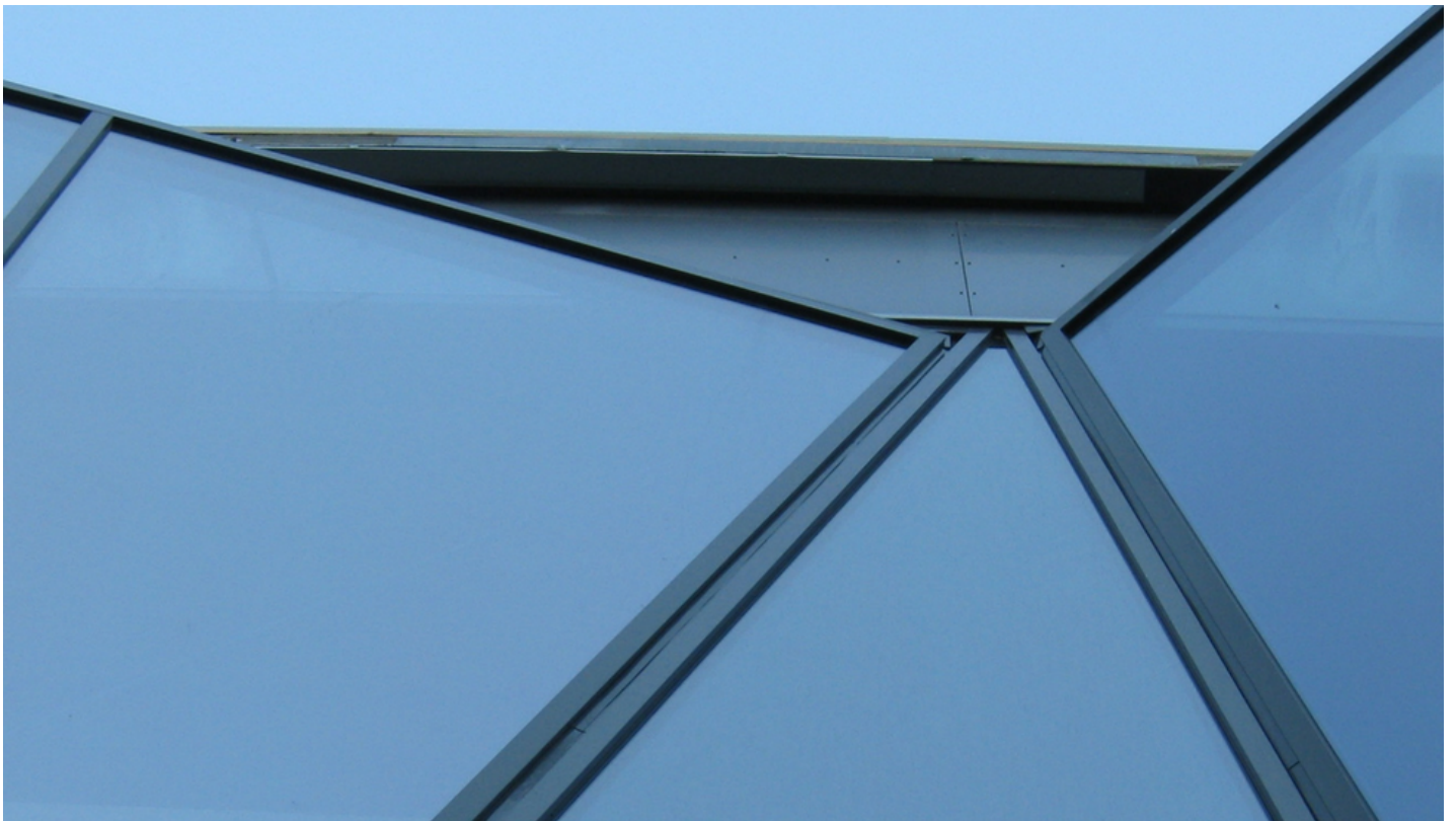
Glazen gevel met SGG COOL-LITE SKN 154 | Saint-Gobain Building Glass