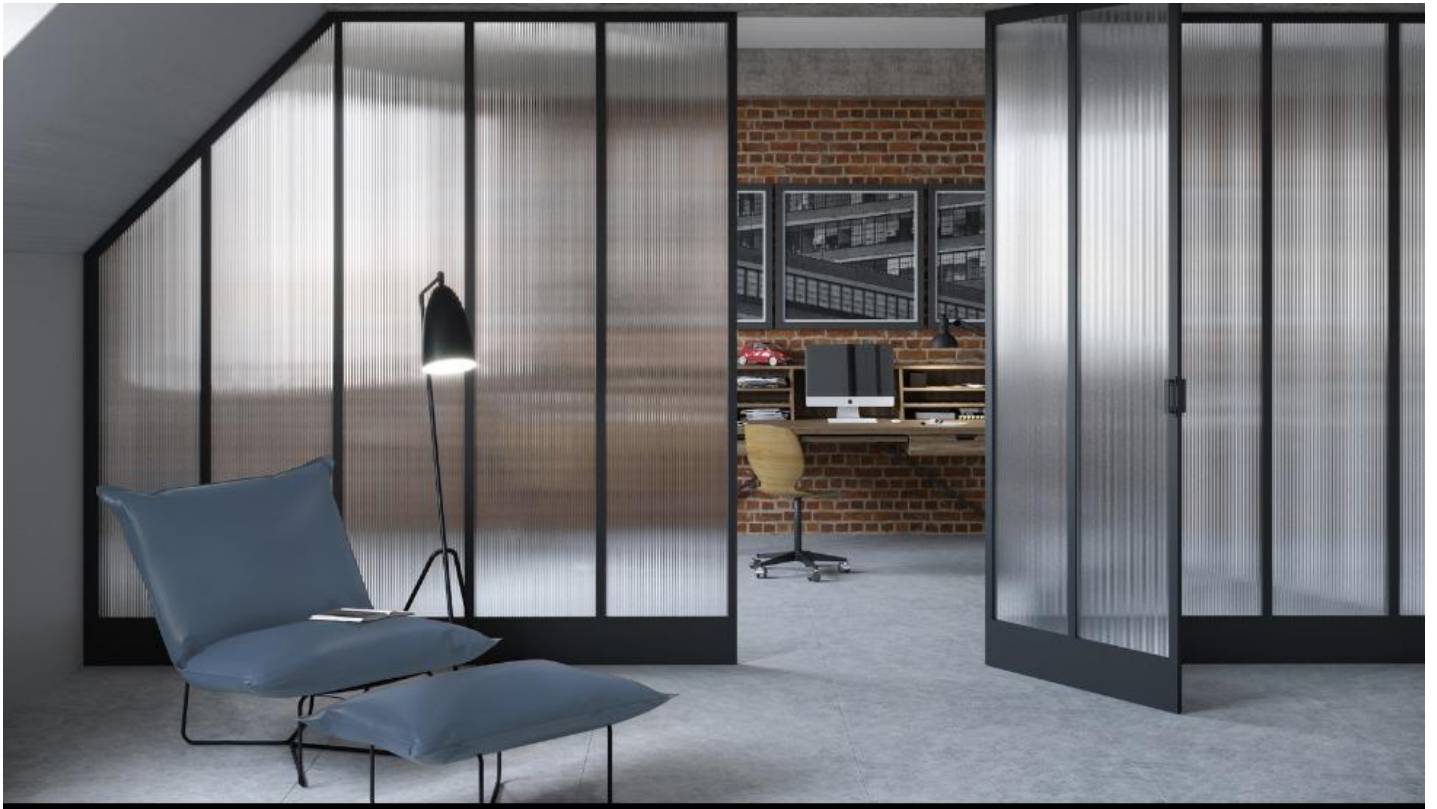
Helder & gekleurd figuurglas voor een mooi interieur met voldoende privacy | SGG DECORGLASS