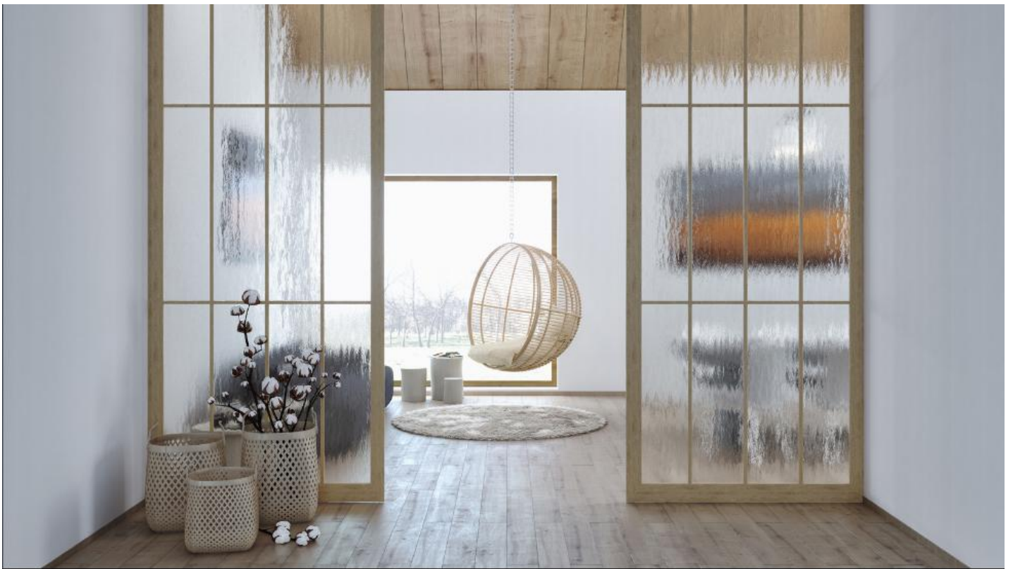
Saint-Gobain Building Glass | SGG DECORGLASS Interieurglas