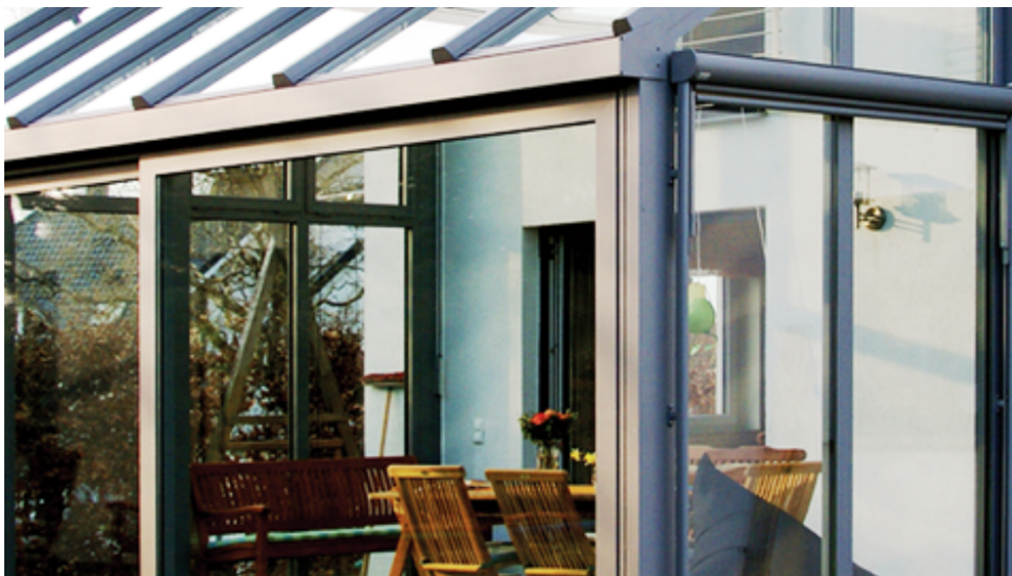
CLIMAPLUS SUN | Zonwerend isolatieglas | Saint-Gobain Building Glass