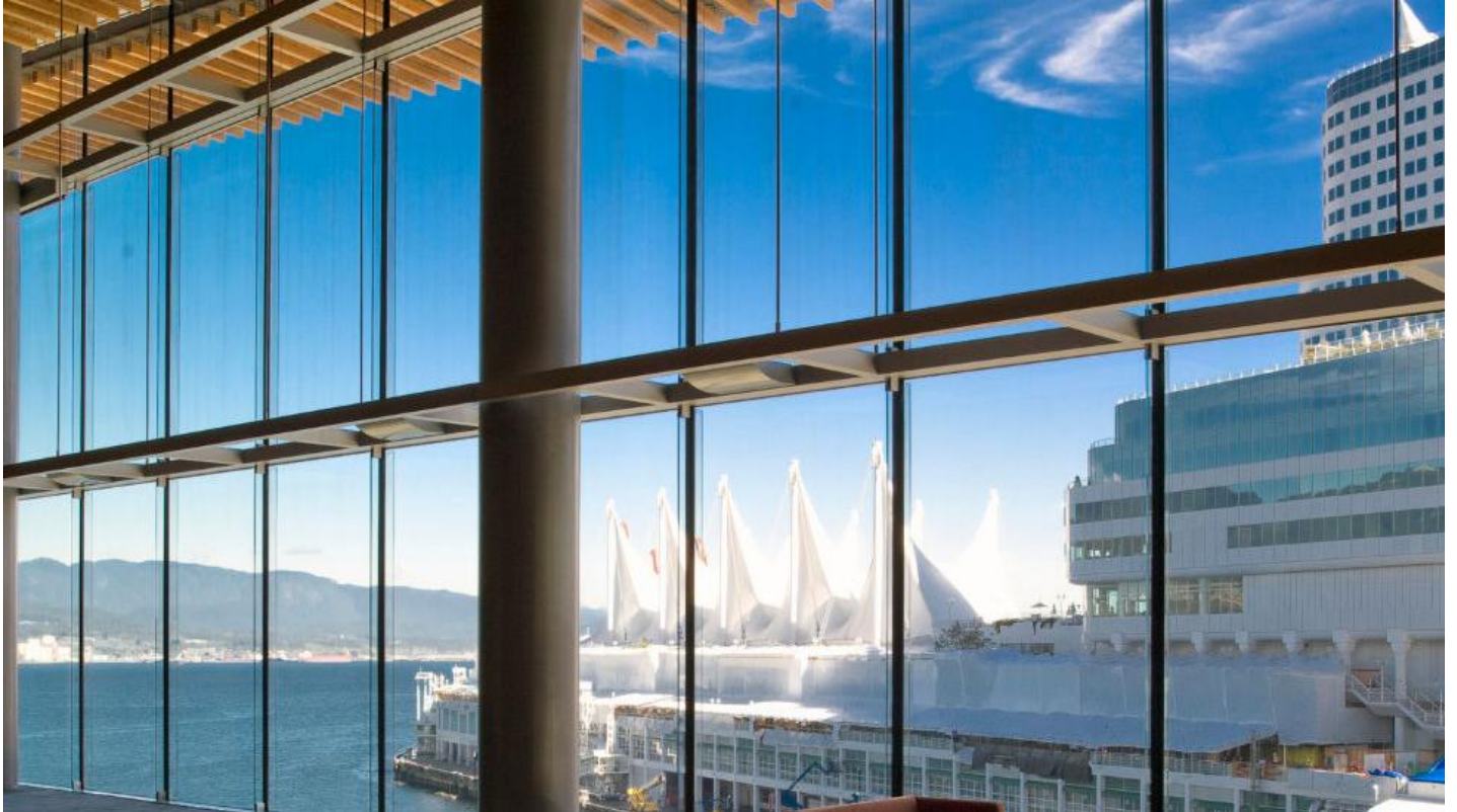
DIAMANT is een uniek extra helder glas.