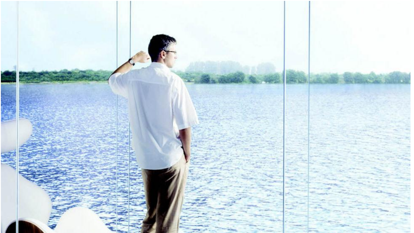
DIAMANT extra helder glas met zeer laag ijzeroxidegehalte